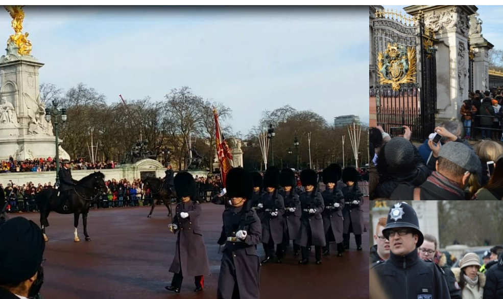
Ci-dessus : La relève de la garde en tenue d'hiver et avec leur fameux bonnet d'ours pour marquer la défaite des gardes impériaux français en 1815 à Waterloo.